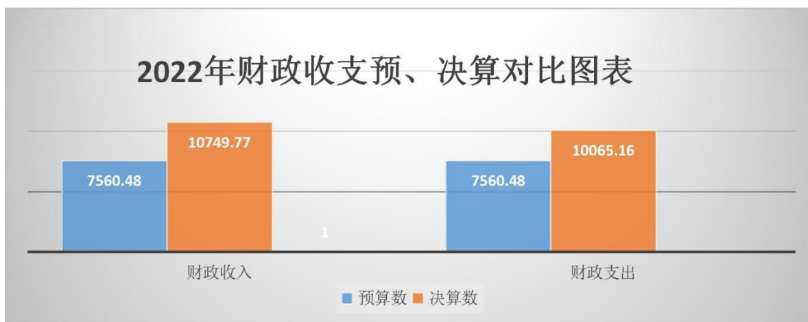
图四：财政拨款收支与年初预算数对比

效和年终考核奖两个项目，且两项目金额总和比以前三个项奖金总和高；本年支出 10065.16 万元，完成年初预算的 133.13%，比年初预算增加 2504.68 万元，决算数大于预算数主要原因是补发 2021 年的绩效奖金，同时在 2022 年的工资构成中增加了补充绩效和年终考核奖两个项目，且两项目金额总和比以前三个项奖金总和高。如图四所示：