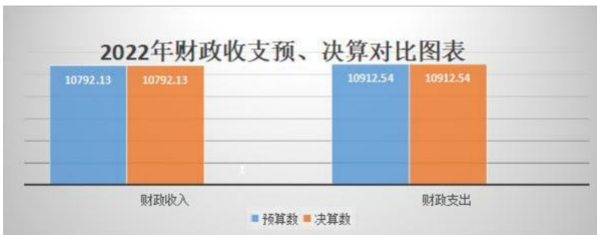
图五：财政拨款收支与年初预算数对比