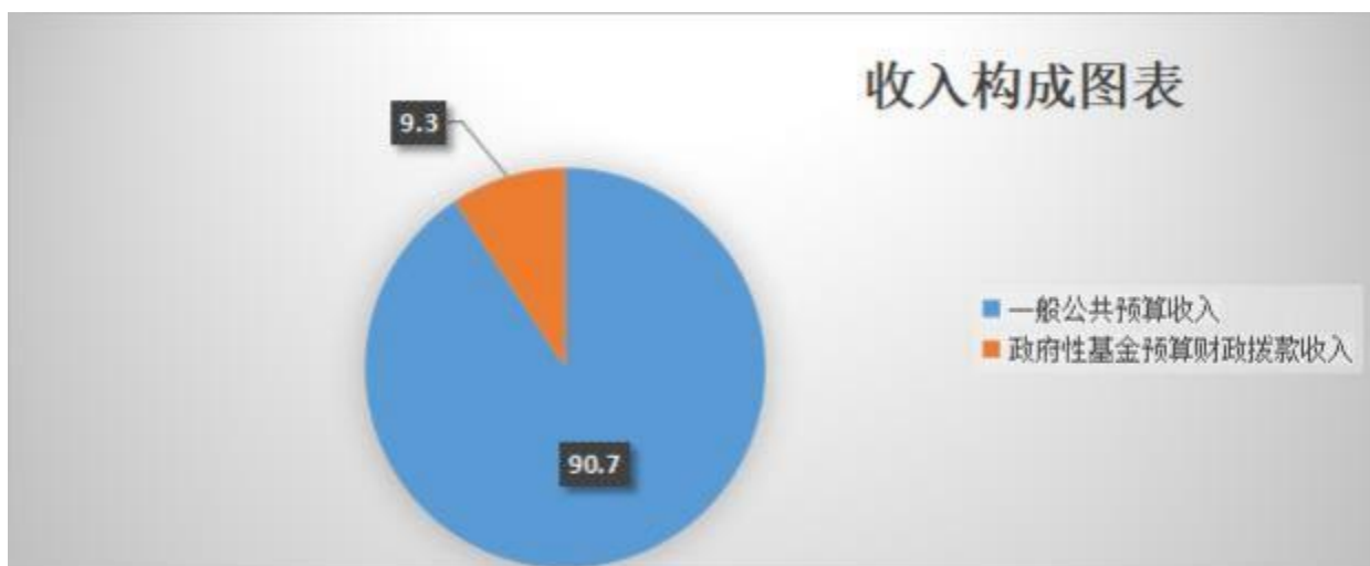
图二：收入构成图表

本单位2022年度收入合计10792.13万元，其中：一般公共预算财政拨款收入9785.76万元，占90.7%；政府性基金预算财政拨款收入1006.37万元，占9.3%。如图二所示：