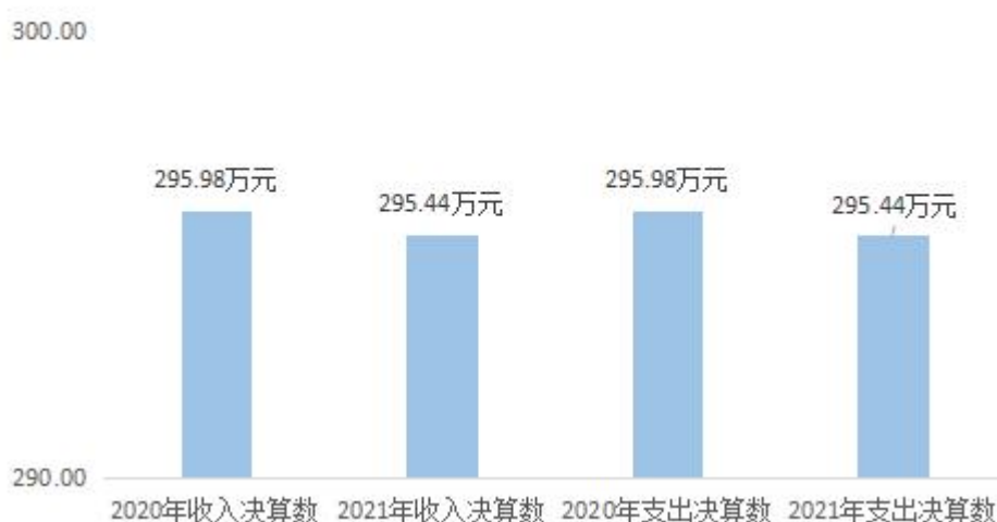
图1：2020年及2021年收支决算对比情况

本单位 2021 年度收、支总计（含结转和结余）295.44 万元。与 2020 年度决算相比，收支各减少 0.54 万元，下降 0.2%，主要原因是在职人员工资保险变化。如图所示：