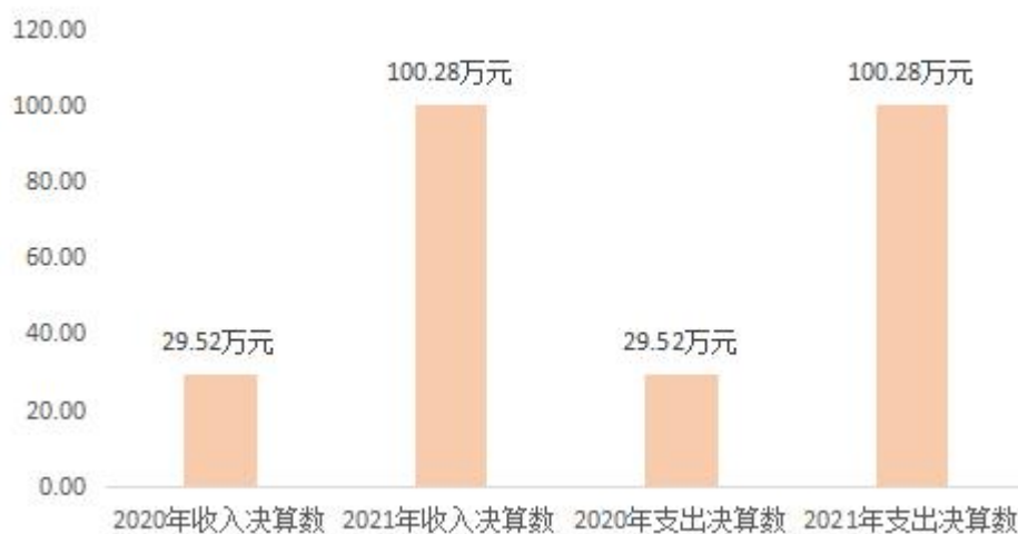
图1：2020年及2021年收支决算对比情况

本单位 2021 年度收、支总计（含结转和结余）100.28 万元。与 2020 年度决算相比，收支各增加 70.76 万元，增长 239.7%，主要原因是人员增加，工资保险收支增加。如图所示：