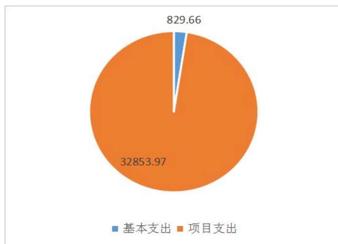
图 2: 支出构成情况 (按支出性质)