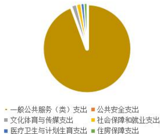
按功能分类支出结构分析图